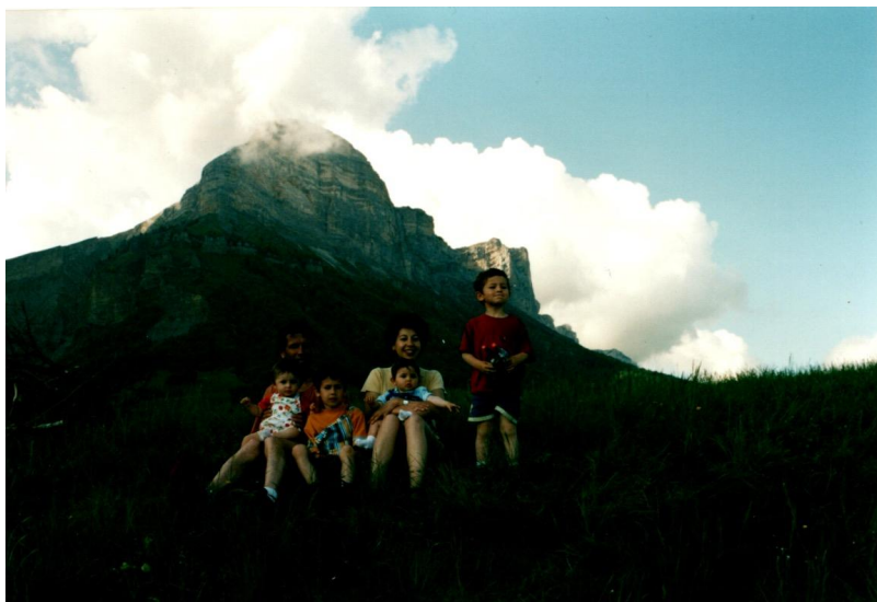
La Dent de Crolles vue de Saint Pancrasse. Paradise on earth as Sami used to say.