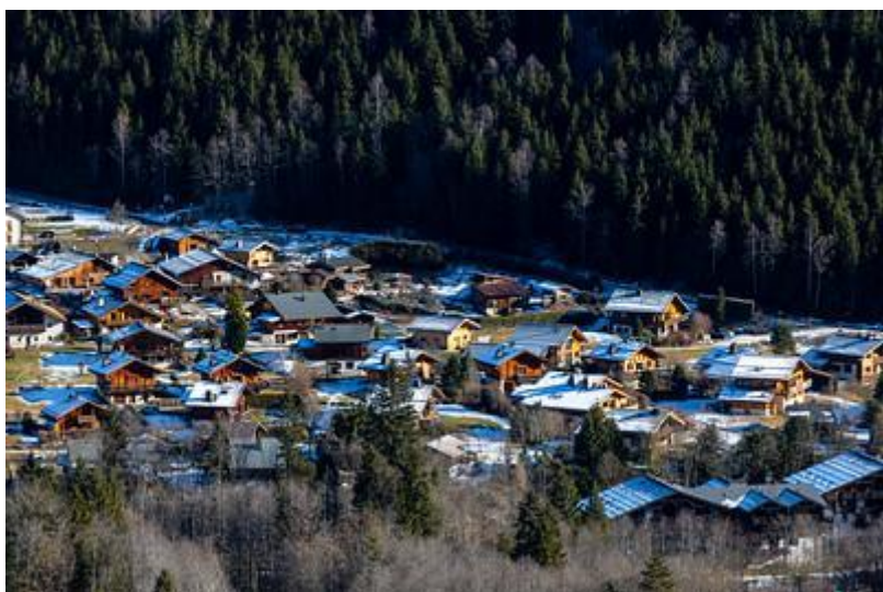
Les Contamines Montjoie