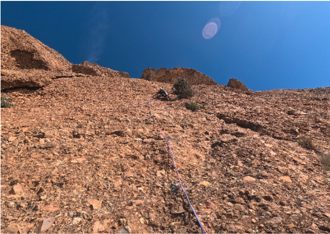
Sami dans L6

Puis vient la traversée et le surplomb final qu'il enchaîne avec un repos, mais avec beaucoup d'aisance, notamment le rétablissement qui est difficile.